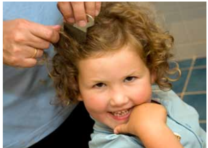
De uitkammethode is het meest natuurlijke middel tegen hoofdluis

In de vorm van shampoos, sprays, crèmes en lotions zijn verschillende producten te verkrijgen. Het verschil tussen de producten heeft vooral te maken met de werkzame stof die erin zit. Op dit moment biedt geen enkel antihoofdluismiddel 100 % 'garantie'. Informeer naar bijwerkingen en contra-indicaties, want kinderen met hooikoorts, cara of eczeem kunnen gevoelig zijn voor één van de werkzame stoffen. Lees ook de bijsluiter goed door en volg de werkwijze die daarin staat. Na 1 week dient u de behandeling met het antihoofdluismiddel te herhalen. Bovendien moet de behandeling met antihoofdluismiddelen gecombineerd worden met de uitkammethode: twee weken het haar dagelijks doorkammen met een fijntandige kam, in combinatie met crèmespoeling.