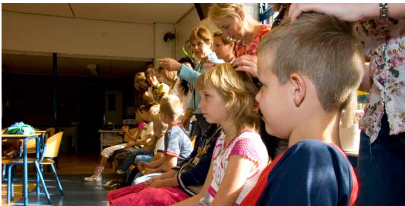
Een ouderwerkgroep kan op school de kinderen regelmatig controleren.

Niet alle ouders willen dat hun kind gecontroleerd wordt door een andere ouder. De school kan dit ondervangen door de luizencontrole in het schoolreglement op te nemen. Daarnaast kunnen ouders én kinderen gestimuleerd worden om regelmatig te controleren op hoofdluis, en hoofdluis te melden aan de school. Als een kind hoofdluis heeft, is het verstandig om alle kinderen uit die groep een informatiebrief over hoofdluis mee naar huis te geven.