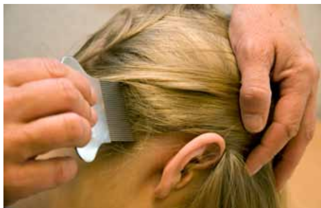
Kam het haar met een fijntandige kam boven een wit papier of de wasbak.